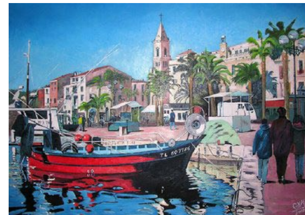
Der Fischerhafen von Sanary-sur-Mer