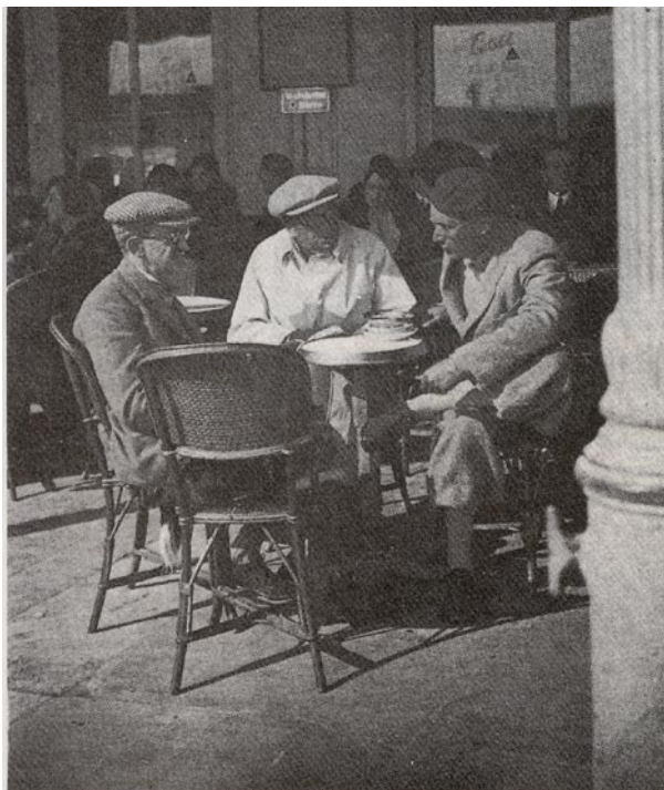
René Schickele (Mitte) im Café in Toulon. (Deutsches Literaturarchiv, Marbach a. N.)

Die Veranstaltung gehört zu der Reihe LiteraTours . Die unter diesem geschützten Label von uns angebotenen Studienreisen laden dazu ein, Orte und Landschaften in Frankreich und Deutschland auf den Spuren und mit den Augen von Dichtern und Schriftstellern beider Länder neu zu entdecken ( www.literatours.de.vu ).